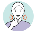
Husten oder Kratzen im Hals