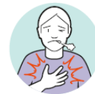
Atembeschwerden oder Atemnot