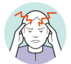
Muskel- und Kopfschmerzen